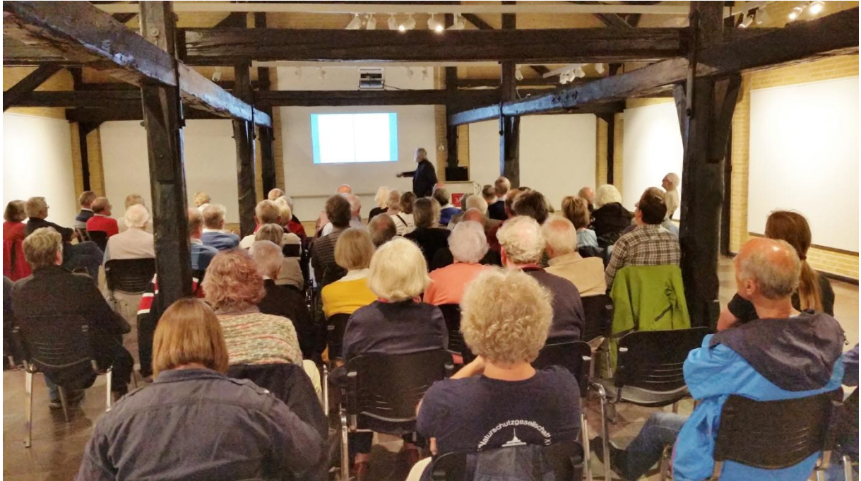
Vor großem Publikum in der Ausstellungshalle im Stadtmuseums Schleswig