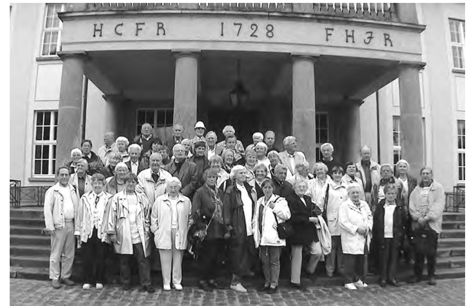
Die Teilnehmer vor dem Herrenhaus Altenhof.